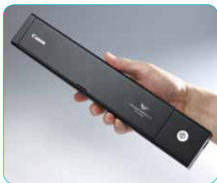
Výjimečně štíhlý a lehký