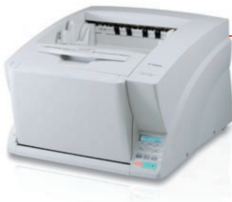
Stroj DR-X10C je schopen zpracovat širokou škálu velikostí dokumentů v jediné dávce

Inovativní funkce společnosti Canon – detekce sešití – ihned zastaví podávání dokumentu, jakmile stroj rozpozná sešivací sponku. Dokument i zařízení jsou tak chráněny před poškozením.