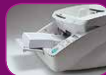
Nejnižší poloha (500 listů)