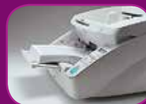
Střední poloha (300 listů)