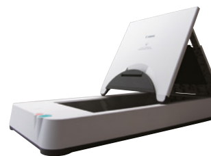
A4 Flatbed Scanner Unit 101